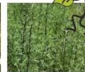
Verlotscher Beifuss Artemisia verlotiorum Ganze Pflanze