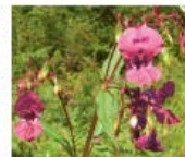
Drüsiges Springkraut Impatiens glandulifera Ganze Pflanze