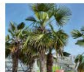
Hanfpalme Trachycarpus fortunei Blüten und Früchte