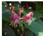
Asiatische Geissblätter Lonicera heryi, L. japonica Ganze Pflanze