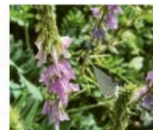
Geissraute Galaga officinalis Hülsenfrüchte