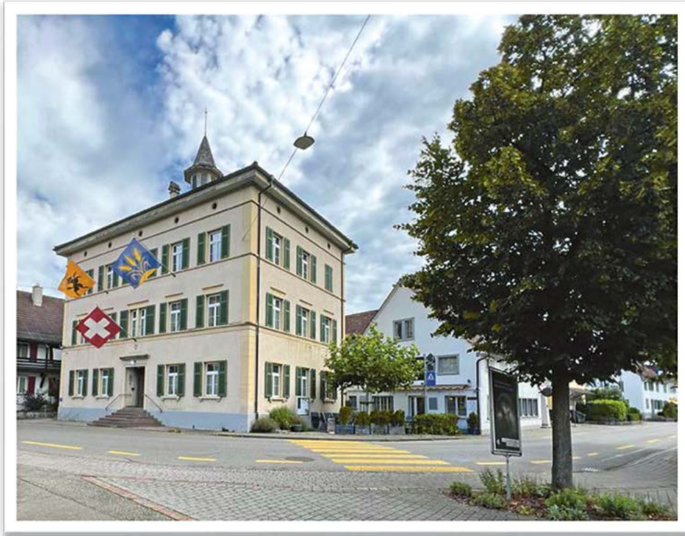
Gemeindehaus 1. August 2025