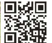
Weitere Pflanzen und Informationen

Wo Sie den Neophytensack kostenlos beziehen und wo Sie ihn entsorgen können, entnehmen Sie bitte dem Abfallkalender Ihrer Gemeinde. Grössere Mengen an Ast- und Wurzelmaterial können direkt bei der KVA Thurgau oder beim ZAB angeliefert werden.