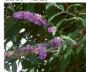
Sommerflieder Buddleja davidi Blüten und Samen