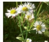
Einjähriges Berufskraut Eigeron annuus Ganze Pflanze