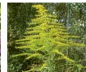
Amerik. Goldruten Solidago canadensis, S. gigantea Ganze Pflanze