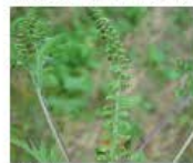
Ambrosia Ambrosia artemisiifolia Ganze Pflanze

Alle fortpflanzungsfähigen Pflanzenteile von exotischen Problempflanzen werden im Neophytensack entsorgt.