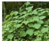
Blauglockenbaum Paulownia tomentosa Wurzeln, Blüten und Samen