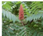
Essigbaum Rhus typhina Wurzeln, Blüten und Samen