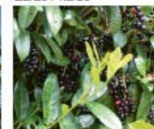
Kirschlorbeer Prunus laurocerasus Früchte und Wurzeln