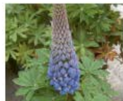
Vielblättrige Lupine Lupinus polyphyllus Ganze Pflanze