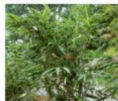
Japanischer Bambus Pseudosasa japonica Wurzeln, Blüten und Samen