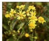
Schmalbl. Greiskraut Senecio inaequidens Ganze Pflanze