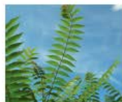
Götterbaum Ailanthus altissima Wurzeln, Blüten und Samen