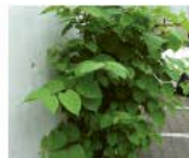
Staudenknöteriche Reynoutria spp. Alles Pflanzenmaterial aus dem Boden