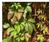
Jungferrebe Parthenocissus agg. P. inserta, P. quinquefolia Ganze Pflanze