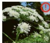
Riesenbärenklau Heracleum mantegazzianum Wurzeln, Blüten und Samen